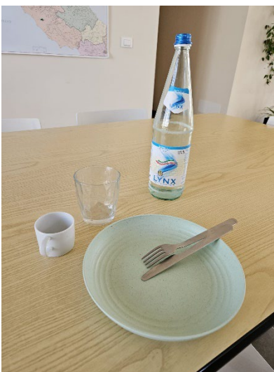
Posate, bicchieri, piatti e tazzine riutilizzabili messi a disposizione per dipendenti e collaboratori e utilizzo di acqua in bottiglie di vetro (vuoto a rendere)