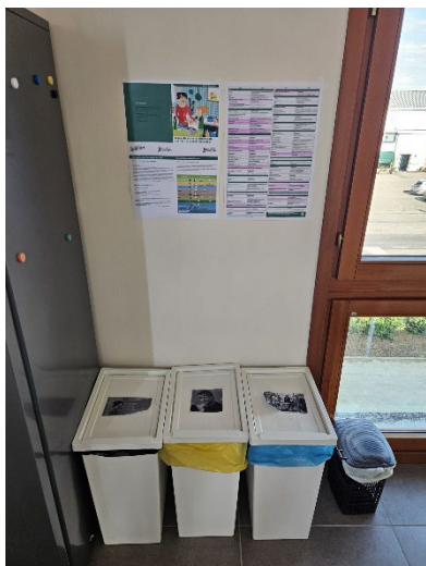
Sala mensa adibita con contenitori e guida per la raccolta differenziata

Spredo alimentare: In collaborazione con Camst, monitoriamo e riduciamo lo spreco di cibo attraverso feedback regolari dai dipendenti e dai clienti.