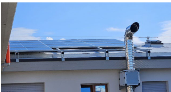
Impianto fotovoltaico in uso

Consumo di risorse: Analizziamo costantemente i nostri consumi di elettricità e acqua per identificare aree di miglioramento e implementare pratiche più sostenibili. Stiamo lavorando per stabilire obiettivi di riduzione concreti e misurabili per il prossimo anno